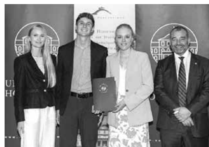
Preis für studentisches Engagement: Kreditwirtschaftliche Colloquium Hohenheim (KCH)

Für ihr herausragendes Engagement als studentische Initiative, die das Campusleben bereichert, wurde das Kreditwirtschaftliche Colloquium Hohenheim mit dem HMD-Preis 2024 ausgezeichnet.