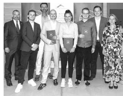
Master Preisträger:innen